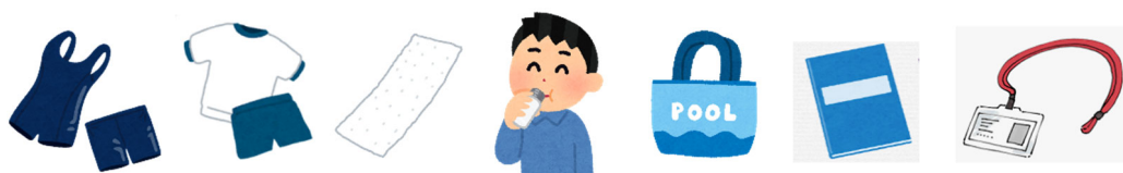
水着・T シャツ・短パン・タオル・飲み物・プールバッグ・ダイブノート・会員証